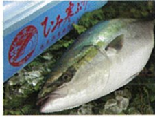
「富山湾の王者」ひみふり ／氷見市