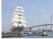
「海の貴婦人」と呼ばれる帆船-海王丸 ／射水市