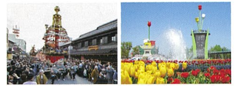
ユネスコ無形文化遺産-高岡御車山祭 ／高岡市 北陸の春を呼ぶとなみチューリップフェア ／砺波市