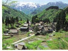
世界遺産-五箇山合掌造り集落(相倉集落) ／南砺市