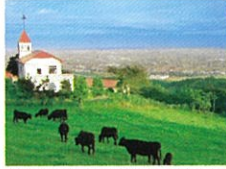
優良和牛を育成する稲葉山牧野 ／小矢部市